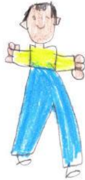
Figura 1 - DFH niña 12 años. Aplicando la norma Koppitz no aparecen 2 ítems esperados (brazos hacia abajo y brazos unidos hombro). No hay ítems excepcionales. Puntuación total=3 (C.I.entre 70-90). Indicadores emocionales: figura pequeña, brazos cortos, asimetría derecha-izquierda (piernas, manos, ojos, orejas...) (1/4)