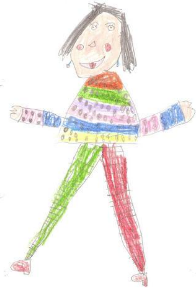
Figura 3 - Niña 5 años. 4 ítems no esperados (brazos y piernas de dos dimensiones, cabello, ropa) + 2 ítems excepcionales (2 labios, pupilas). Puntuación Koppitz=11. (C.I. >110). Rasgos emocionales positivos: brazos y piernas abiertos (sociabilidad, extraversión, apertura hacia los demás...). (3/4)