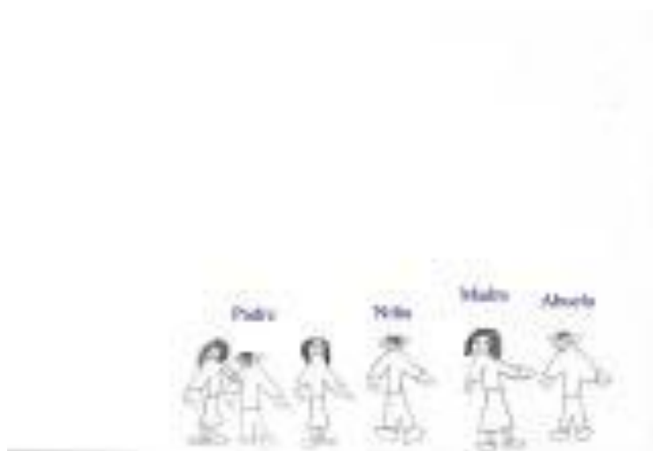
Niño de 10 años