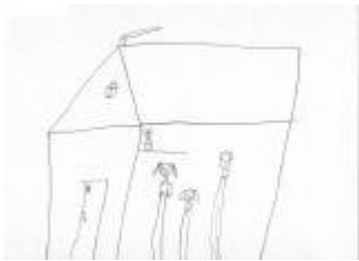
Niña de 7 años