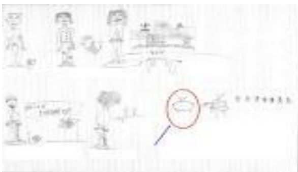
Niño de 12 años