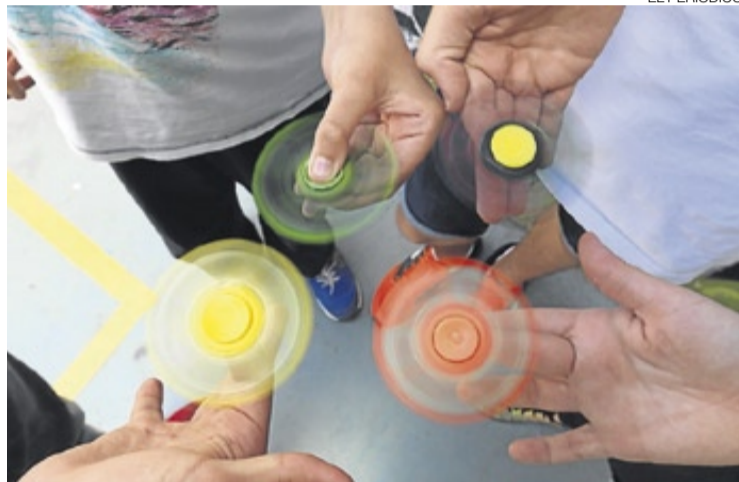
► Varios niños juegan con su 'spinner', el juguete de moda.

La popularidad del juguete se dispara también en Aragón, aunque no se plantea como herramienta pedagógica en clase