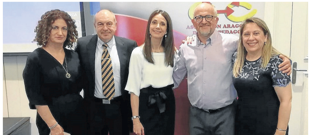
Miembros de la junta directiva, en el acto de celebración del 25 aniversario. ASOC. ARAGONESA DE PSICOPEDAGOGÍA

Año 1994. Un grupo de psicólogos y pedagogos, con las oposiciones recién aprobadas y una mochila cargada de ilusiones, nos lanzamos a crear una asociación que sirviera para dar cauce a nuestras inquietudes. No podíamos imaginar que llegaríamos a celebrar el 25 aniversario de la Asociación Aragonesa de Psicopedagogía (AAP), con este éxito. Hoy, somos más de 300, mantenemos relación con cientos de alumnos y profesores que han participado en nuestras actividades; hemos firmado convenios de colaboración con 48 entidades y organizado más de un millar de actividades formativas, además de siete congresos internacionales. Y nos sentimos muy orgullosos porque hemos contribuido a que Zaragoza y Aragón se hayan posicionado como referente nacional educativo. Y todo, gracias al trabajo y la ilusión de personas que han nutrido la Asociación. La excelente relación interpersonal que existe entre nosotros es, precisamente, una de nuestras señas de identidad.