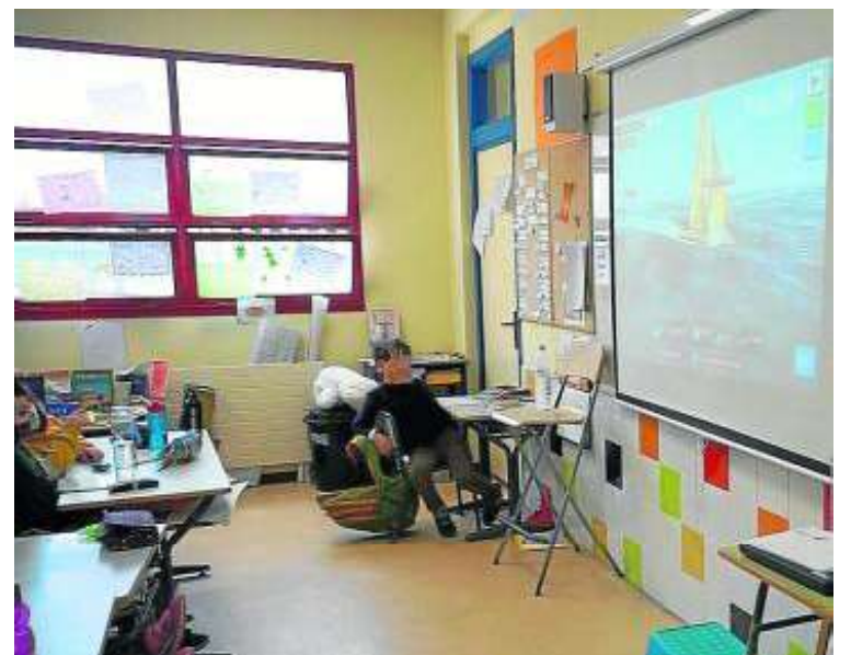
Los regatistas virtuales, en acción desde el aula.