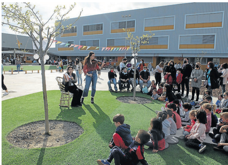
Los pequeños disfrutaron de música en directo. CPI ARCOSUR

El centro escolar se convirtió por un día en una fiesta del libro con divertidas actividades y talleres, bajo el lema 'Las historias son alas que nos ayudan a remontar el vuelo cada día', del escritor canadiense Richard Van Camp. En el patio del colegio se creó un espacio musical, donde los jóvenes disfrutaron de la presencia de músicos y músicas y sus armonías. También se montó una biblioteca al aire libre, con varios libros prestados por bibliotecas públicas para que los niños y ni-