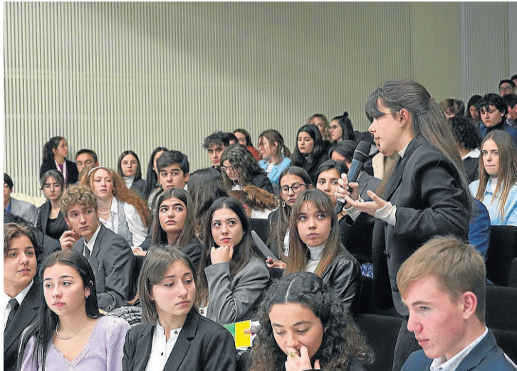
Fomentando la cultura de debate parlamentario constructivo.