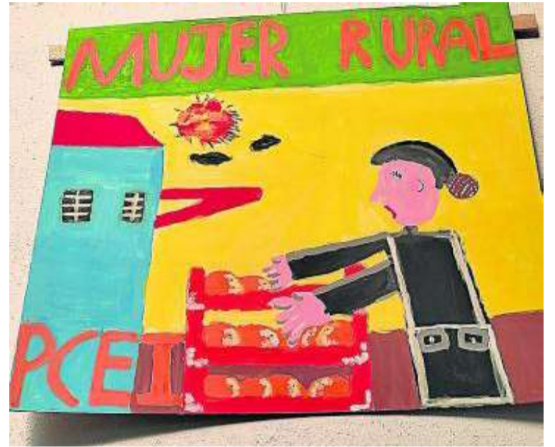
Uno de los murales, realizados en el taller de plástica. CEE GLORIA FUERTES

Chicos y chicas colocaron tres estupendos murales, realizados en el taller de plástica, con su profesor de área, y en los que se visibiliza a tres mujeres del medio rural. Seguidamente, se leyeron otras reflexiones trabajadas en el aula con su profesorado tutor tan